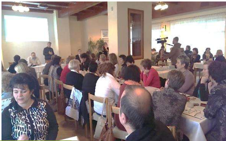
Foto z úvodní konference TŠ Rudka u Kunštátu, 23.1.2014